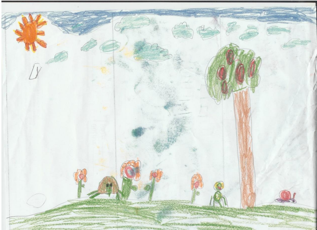
ציור של כבוד (צב), יושר (שבלול) ושוויון (צפרדע) שקיבלתי במתנה מאחד הילדים בסיומה של התכנית.